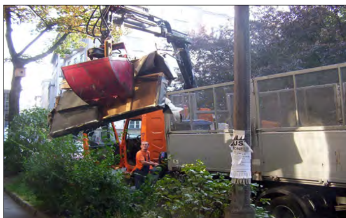
Fot. 2. Załadunek OWG z wykorzystaniem HDS

Zastosowanie systemu kontenerowej zbiórki ułatwia odbiór odpadów, gdyż wykorzystywane w niej są pojazdy o nadwoziu z hydraulicznym urządzeniem wciągającym kontener. Nie zawsze jednak duże pojazdy mogą zmieścić się w wąskich osiedlowych uliczkach. Dlatego do zbiórki OWG używane są również pojazdy o dopuszczalnej masie całkowitej do 3,5 Mg zazwyczaj z otwartą przestrzenią ładunkową lub typu furgon. Pojazdy wypełnione OWG przyjeżdżając do miejsca magazynowania lub składowania OWG są dwukrotnie ważone: przed i po rozładunku. Rozładunek w zależności od rodzaju pojazdu odbywa się poprzez otwarcie burt kontenera i użycie hydraulicznego podnośnika do przechylenia i wysypania zawartości. Pojazdy skrzyniowe zazwyczaj wyposażone są w kiper, czyli urządzenie umożliwiające przechylenie przestrzeni ładunkowej w celu jej opróżnienia. W przypadku gdy wraz z meblami zbierany jest zużyty sprzęt elektryczny i elektroniczny, do za/wyładunku zalecany jest system ręczny, aby