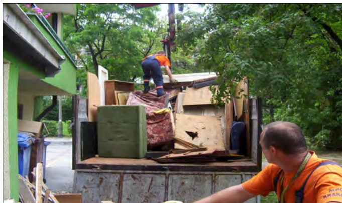
Fot .1. Załadunek ręczny OWG